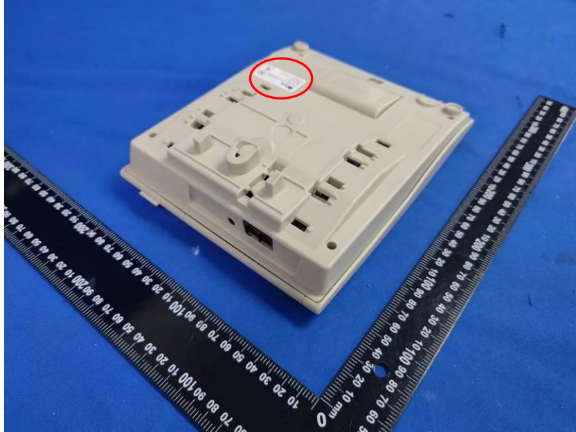
产品外观 (红圈表示产品铭牌所在位置)